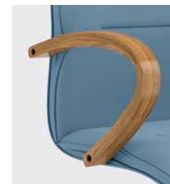
Braccioli in legno opzionali Optional wooden armrests