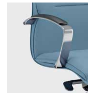
Braccioli in alluminio con pad in poliuretano nero di serie Standard aluminium armrests with black polyurethane pad