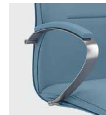
Braccioli in acciaio cromato con pad imbottito opzionali Optional chromed steel armrests with upholstered pad