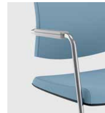
Braccioli in acciaio sedute fisse Fixed chairs with steel armrests