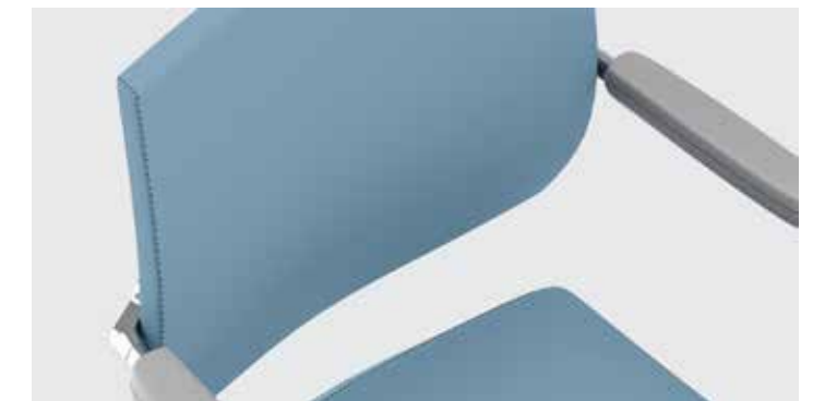
Cuciture sedute fisse Fixed chair seams