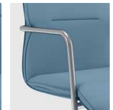
Braccioli in acciaio seduta fissa a slitta Fixed cantilever chair with steel armrests