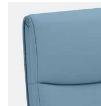
Lombare regolabile in altezza e profondità Adjustable lumbar support in height and depth