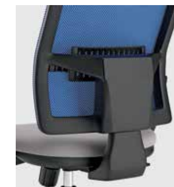
Schienale Tipo 1 Type 1 backrest