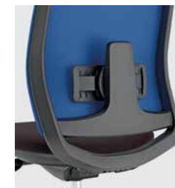
Schienale Tipo 2 Type 2 backrest