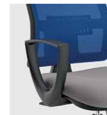
Braccioli fissi opzionali Optional fixed armrests