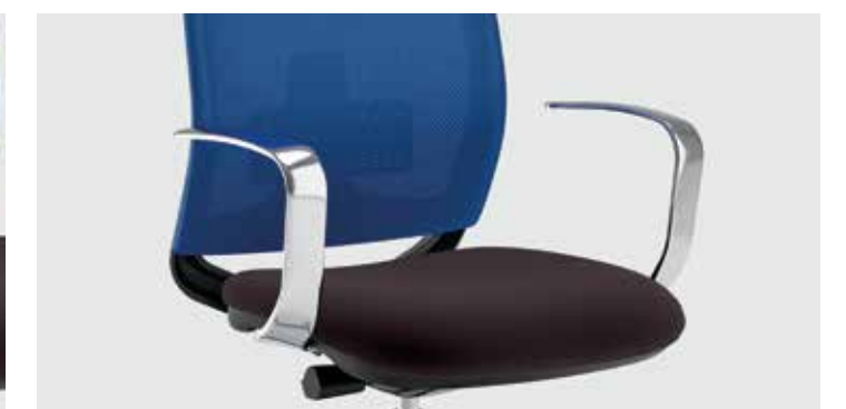
Braccioli fissi in alluminio opzionali Optional fixed aluminium armrests