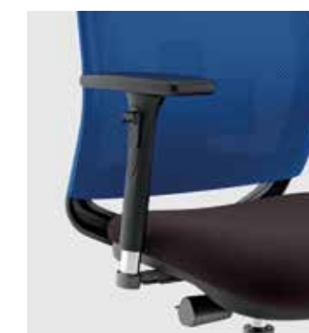
Braccioli regolabile 3D opzionali Optional 3D adjustable armrests