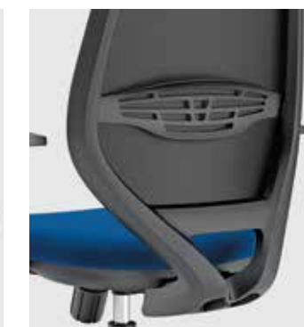
Schienale Tipo 3 Type 3 backrest