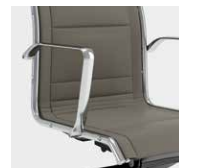
Interamente imbottita Fully padded