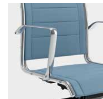
Imbottitura separata Split padded