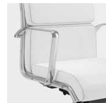
Con cuscini With cushions