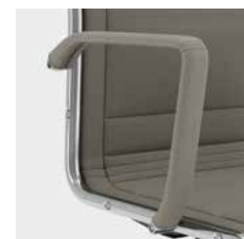
Braccioli in alluminio con rivestimento in tinta con la poltrona Aluminium armrests with upholstery in the same colour as the armchair