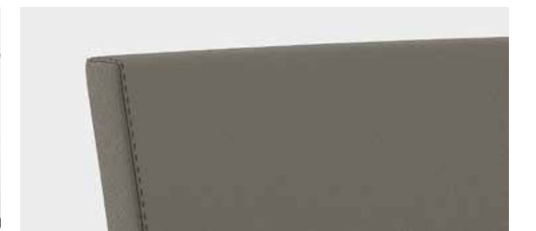
Cuciture sedute fisse Fixed chair seams