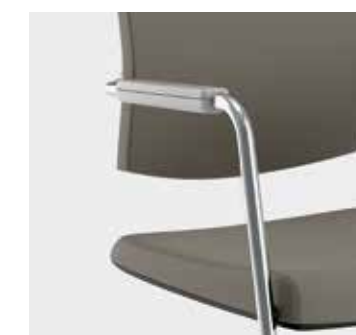
Braccioli in acciaio sedute fisse Fixed chairs with steel armrests