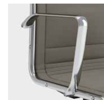
Braccioli in alluminio Aluminium armrests