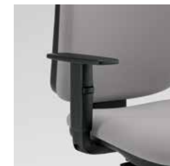
Bracciolo in nylon regolabile nero opzionale Optional adjustable black nylon armrest