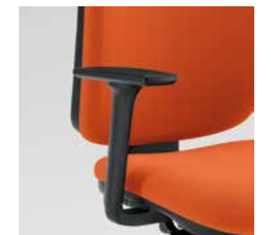
Bracciolo regolabile 4D opzionale Optional 4D adjustable armrest