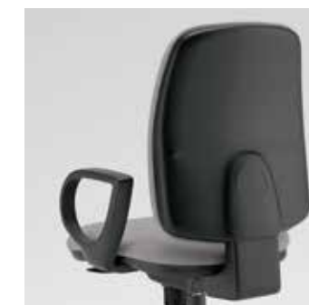
Retro schienale Rear backrest