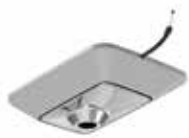
006 Oscillante con blocco - Oscillante attivabile tramite cavo - Una posizione di blocco