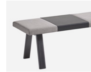
Aluminum seat tray Bandeja para asiento