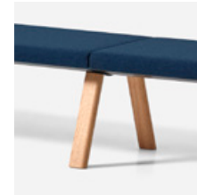
Intermediate leg Pata intermedia

es - Se pueden unir varios bancos utilizando patas intermedias o mesas de de conexión.