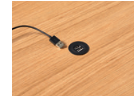
USB charger with 2 ports Ø34mm. Cargador USB con dos puertos Ø34mm.