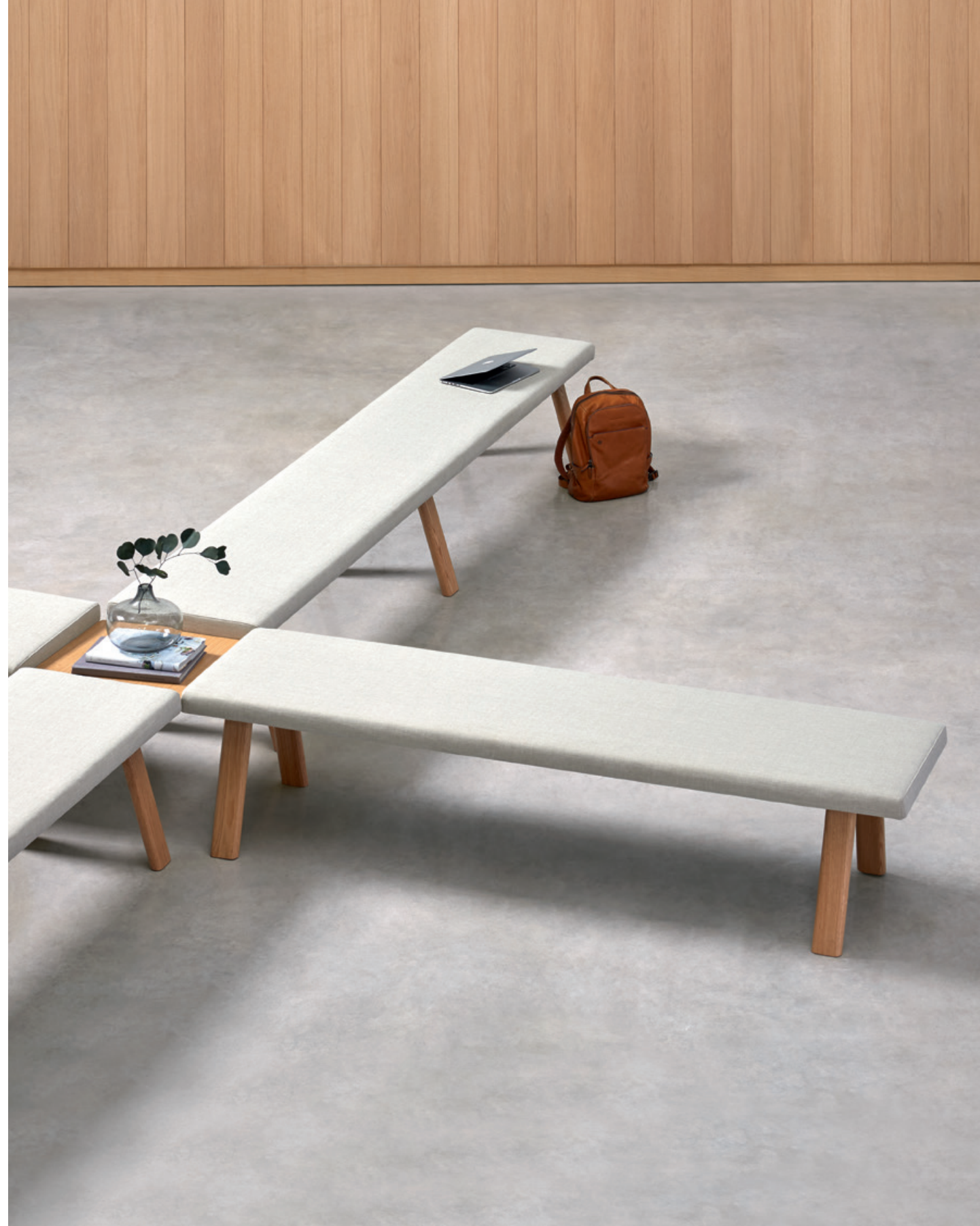
es — MESAS DE CONEXIÓN. Una serie de mesas auxiliares de conexión lateral permiten configurar múltiples formas y tamaños, facilitando la integración de los bancos en una amplia variedad de espacios.