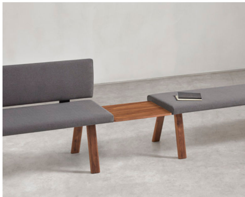
en — CONNECTING TABLES. A series of connecting side tables allow the configuration of multiple shapes and sizes facilitating the integration of the benches in a wide variety of spaces.