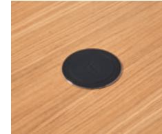
Wireless induction charger Ø80mm. Cargador de inducción inalámbrico Ø80mm.