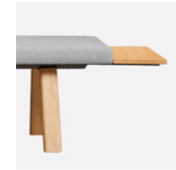
End table top Mesa extremo lateral