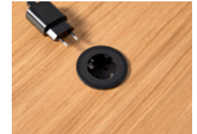
Round schuko socket Ø60mm. Enchufe de sobremesa Ø60mm.