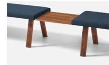
Connecting table Mesa de conexión