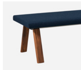
— Solid walnut (natural) Nogal macizo (natural)