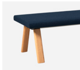
— Solid oak (natural or stained) Roble macizo (natural o teñido)