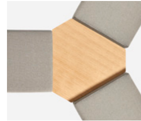
Connecting top 3 ways 120° Mesa de unión 3 salidas 120°