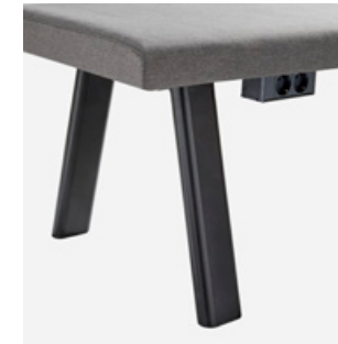
Power box with 2 schuko sockets Caja con 2 enchufes