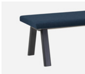
— Aluminum tube (colours M1, M2) Tubo de aluminio (colores M1, M2)