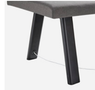
Leg with cable way out Pata con salida para cables