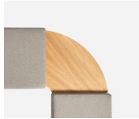
Corner top 90° Mesa de esquina 90°