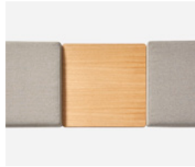
Connecting top 2 ways Mesa de unión 2 salidas