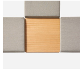
Connecting top 3 ways Mesa de unión 3 salidas