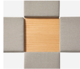
Connecting top 4 ways Mesa de unión 4 salidas