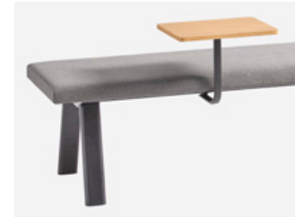
Side table Mesa auxiliar