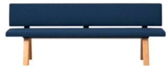
— Single benches with backrest Bancos independientes con respaldo

48x120cm 48x160cm 48x200cm 48x240cm 48x280cm